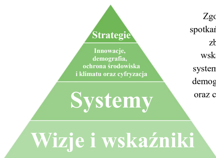
Czterostopniowa piramida metody VISIS

Problemy i koncepcje ich rozwiązania liderzy przedstawiają dzięki wykorzystaniu metody VISIS – zestawu narzędzi umożliwiających efektywne planowanie, wdrażanie, monitoring oraz ewaluację zrównoważonego rozwoju społeczności lokalnych. Osobiste doświadczenia i obserwacje uczestników konsultacji pozwolą na zdefiniowanie najważniejszych wyzwań dla obszaru objętego LSR. Następnie uczestnicy postarają się zanalizować lokalne problemy, dotrzeć do ich źródeł i określić związki przyczynowo-skutkowe między nimi. Kolejny krok posłuży wypracowaniu rozwiązań dla wprowadzenia jak najkorzystniejszych zmian, a na koniec zgromadzeni postarają się o stworzenie jak najlepszej strategii wcielenia tychże pomysłów w życie.